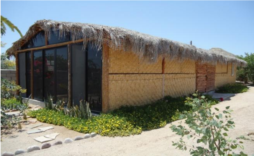
Salón de conferencias de la Fundación

La Fundación de Farmacognosia y Medicina Complementaria y Alternativa de B. C. S., A.C. (FUNDACIÓN FARMECAL de B.C.S., A.C.) es una asociación civil, sin fines de lucro, creada con la finalidad de contribuir a mejorar la salud de la población de manera holística y de orientarle sobre la aplicación de los productos naturales (plantas, animales y organismos marinos) que se emplean como medicinales, en la industria químico-farmacéutica, en el sector agropecuario y otros sectores