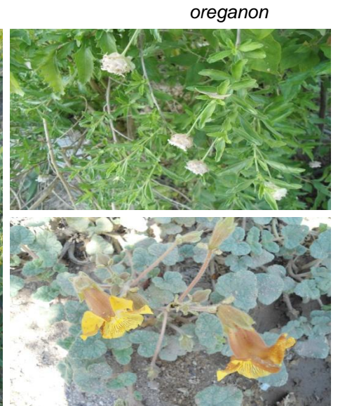
espuela del diablo