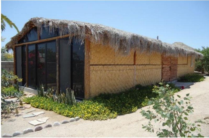
Salón de conferencias

Con el propósito de mantener informada a la población de Baja California Sur, sobre los avances logrados en la investigación científica realizada sobre los productos naturales (plantas medicinales, organismos marinos, microorganismos, etc.), empleados en la Medicina Tradicional de Baja California Sur y de México, tiene el gusto de invitarles a sus: